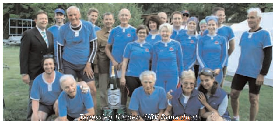
Tagessieg für den WRV Donauhört