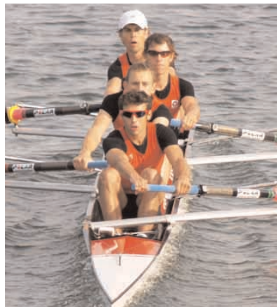
Platz 13 für den LM 4-

LW 2x: 1. POL 7:12,97; 2. ESP 7:15,27, 3. Taupe-